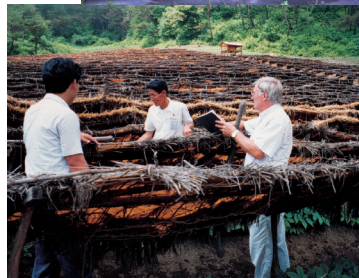
Anbau auf schattigen Feldern