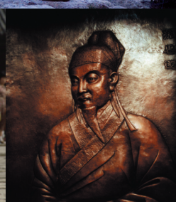
Sun Simiao – Arzt und Heilkundiger (581-682)