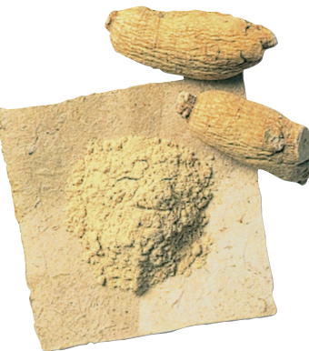
Wurzelpulver – die Basis für unsere Wurzelpulver-Kapseln und Tabletten

Durch das Dämpfungsverfahren werden einzelne Ginsenoside der Rg-3-Gruppe in Ginsenoside der Rh-2-Gruppe umgewandelt. Diesen Rh-2-Ginsenosiden wird eine besondere Bedeutung für die Stärkung des Immunsystems und die Bekämpfung der „freien Radikale“ zugeschrieben.